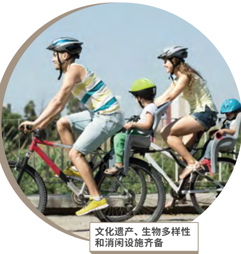
文化遗产、生物多样性和休闲设施齐备

享受一览无遗的绿色景观；沉浸在大自然的怀抱中。公园和自然保护区围绕、同时连接到主要的休闲廊道——如：越岛连道 (Coast-to-Coast Trail)、铁道走廊 (Rail Corridor) 和即将登场的武吉知马-梧槽绿色廊道 (Bukit Timah-Rochor Green Corridor)。