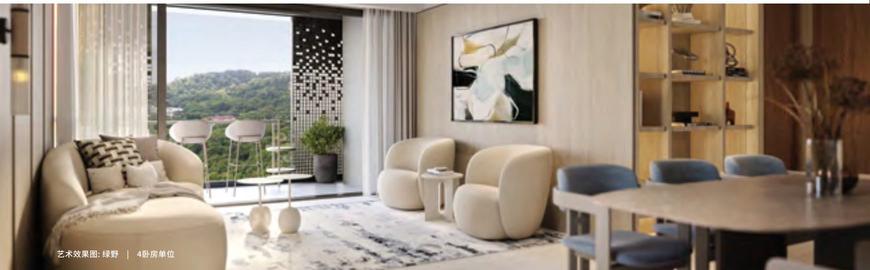
艺术效果图: 绿野 | 4卧房单位