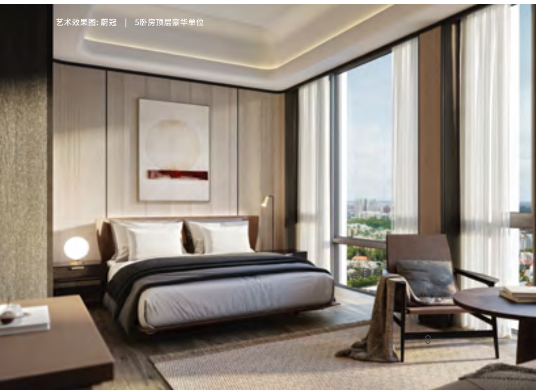
艺术效果图: 蔚冠 | 5卧房顶层豪华单位