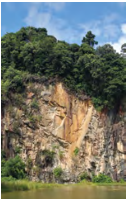
武吉知马自然保护区