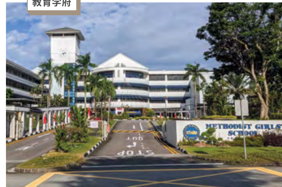
靠近知名教育学府

发展项目迎合人们不断变化的生活方式，设计出绿意盎然的开放空间，结合了包容性；可步行、宜社交，也能完全同大自然融合的新城市中心。全新的格局概念，预计将引起广泛的兴趣，为所有居民和访客，创造了一个群聚的温馨环境。