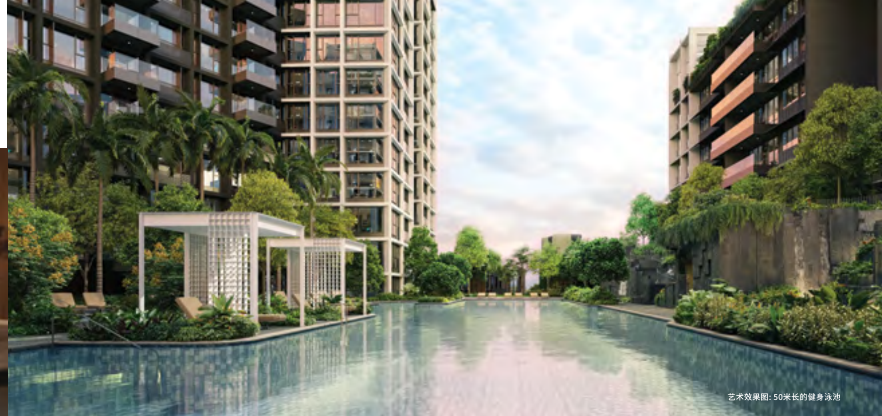
艺术效果图: 50米长的健身泳池