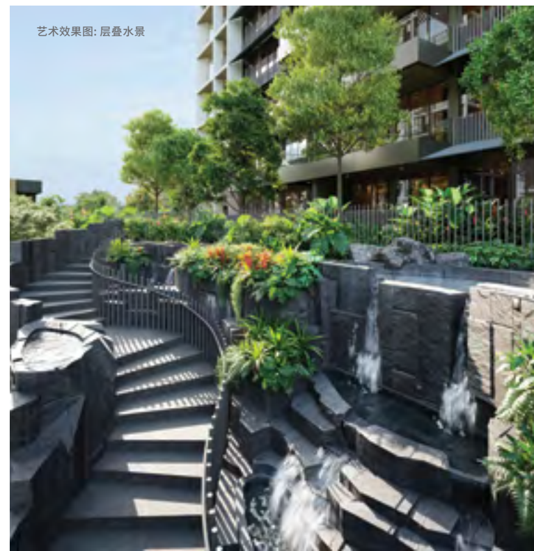
艺术效果图: 层叠水景