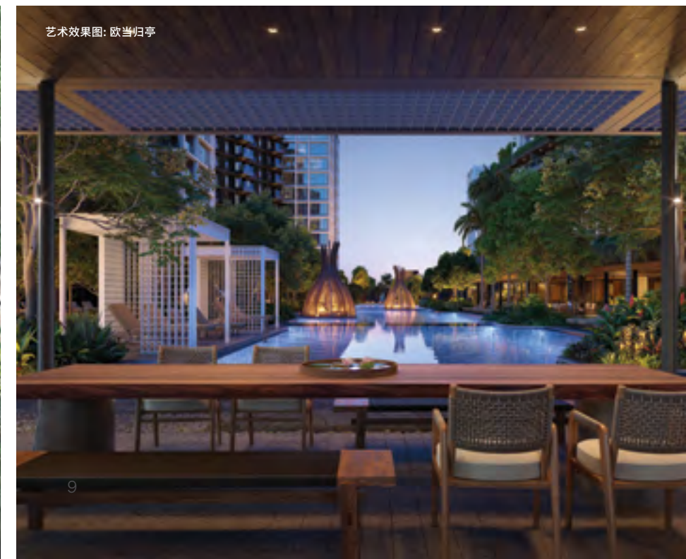
艺术效果图: 欧当归亭