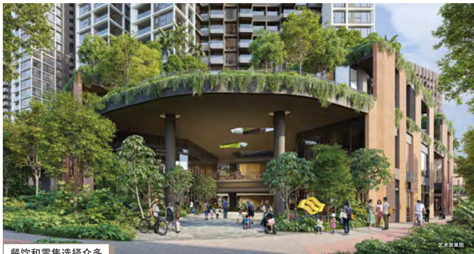
餐饮和零售选择众多

绿荫围绕，位于青麓尚居楼下的 Bukit V 购物中心，四层楼中，有超过2万平方米的零售和社区空间。集购物、娱乐、美食于一处，商场的超市、各式各样的餐饮选择、教育和医疗服务，能满足所有日常所需。